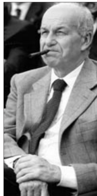
A l'horizon de Fausto Bertinotti : la participation à un futur gouvernement dirigé par Romano Prodi, l'ancien président de la Commission européenne, qui a accéléré la mise en œuvre de l'agenda néolibéral en Europe.

et, sur cette base, qui se donne une cohérence anticapitaliste. Nous avons regroupé autour de cette perspective de nombreux jeunes, beaucoup de militant·es parmi les plus engagés dans les mouvements sociaux, ainsi que de nombreux cadres syndicaux reconnus. L'ampleur des soutiens recueillis est remarquable, d'autant plus que la plupart émanent du réseau des militants actifs de PRC, alors que Bertinotti et la motion 2 ont regroupé une part significative de leurs appuis parmi les simples inscrits, qui ne sont pas actifs dans la vie du parti. Notre objectif est maintenant d'organiser les camarades qui se sont reconnus dans nos positions sur la durée, dans un courant au sein de PRC. ■