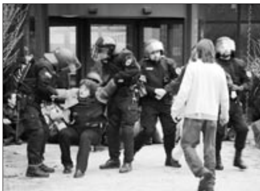
Le durcissement répressif à l'égard des luttes sociales ne se fait pas sentir seulement à Genève. En décembre 2003, la police de Bale-campagne avait brutalement dispersé le piquet de grève devant l'entreprise Allpack. Une procédure judiciaire pour contrainte est toujours en cours contre les syndicalistes.

Genève : la justice multiplie les procédures criminalisant des actions syndicales ou des mouvements associatifs, comme attac. Les restrictions au droit de manifestation s'aggravent. Il s'agit de conforter la prééminence des droits des propriétaires.