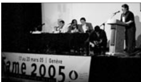
Forum alternatif mondial de l'eau (Fame) à Genève: un délégué bolivien présente la lutte de la population d'El Alto contre la multinationale Suez.

La privatisation de l'eau se prépare, avec l'aide de... l'EPFL. Le combat pour un service public converge avec les luttes, dans les pays du Sud, pour le droit d'accès à l'eau.