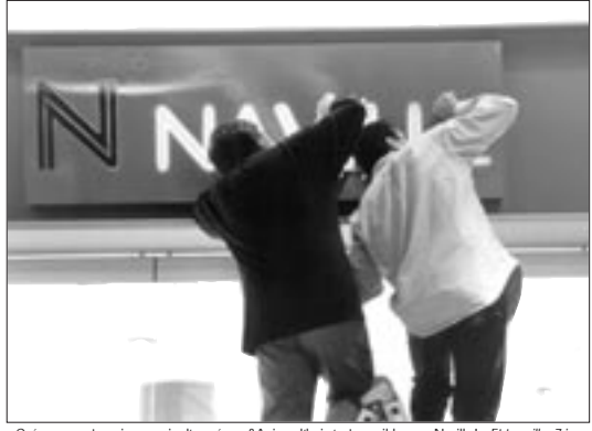
« Créer son entreprise au sein d'un réseau? Aujourd'hui c'est possible avec Naville! » Et travailler 7 jours sur 7 sans limite d'horaire aussi. Naville remet au goût du jour l'autoexploitation.

Viscom, l'association patronale de la branche, vient de publier les résultats 2004 de son enquête sur les salaires: entre 2002 et 2004, pour la première fois, les salaires moyens ont baissé en valeur nominale: de 0,9% pour les personnes qualifiées, de 7,3% pour les semi-qualifiées; de 3,8% pour les personnes sans qualification ( Viscom print & communication , 22 février 2005). Il faut ajouter à cette baisse nominale la progression de l'indice des prix à la consommation (IPC) – 2,2% sur la période – pour approcher la baisse réelle de salaire. L'association patronale a son explication: « Les collaborateurs qui partent à la retraite sont – lorsque leur place de travail est conservée – remplacés par des forces de travail engagées à des salaires significativement plus bas, ce qui a pour effet que la moyenne diminue. » En dix ans, dans une branche où existait une tradition syndicale, les