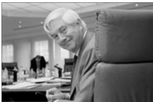
Une bonne dose de PPO (principe du pays d'origine) suffit à réjouir Frits Bolkestein.

Barroso, lui, est calé sur les fondations d'une Constitution que Chirac et Hollande, le patron du PS, supportent. En effet, l'article III-144 du futur Traité constitutionnel précise : « les restrictions à la libre prestation des services à l'intérieur de l'Union sont interdites ».